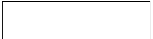
Схема границы балансовой принадлежности

е) границей эксплуатационной ответственности объектов централизованной системы холодного водоснабжения исполнителя и заявителя является: